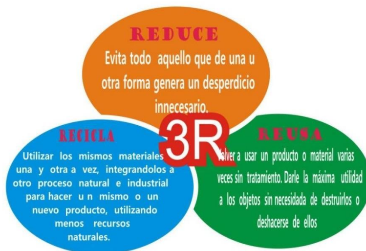
Ilustración 3R: Reduce, Reutiliza y Recicla.